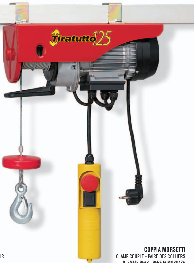
COPPIA MORSETTI CLAMP COUPLE - PAIRE DES COLLIERS KLEMME PAAR - PAREJA MORDAZA

DOUBLE-THROW PULLEY - POULE À DOUBLE TIR DOPPELZUGROLLE - POLEA DE DOBLE TIRO